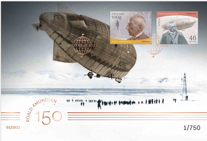
◀ Goldbrief NOK 99