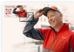
▶ Satz Maximumkarten NOK 52