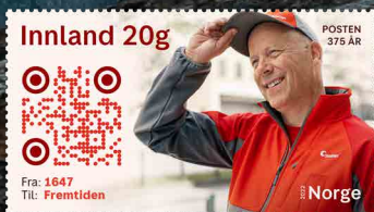
NK 2069 Briefträger.