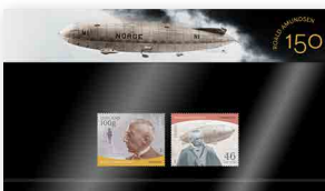
▶ Geschenckpackung NOK 90