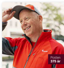
▶ Samlersatz NOK 99