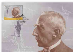
▶ Satz Maximumkarten NOK 88