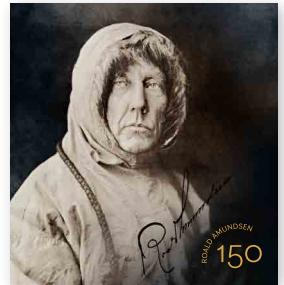
▶ Sammlersatz NOK 171