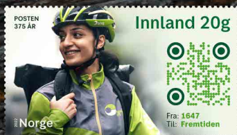
NK 2070 Fahrradbote von Bring.