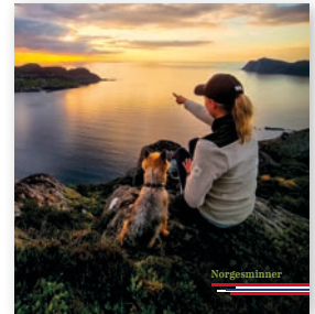
▶ Samlersatz NOK 362