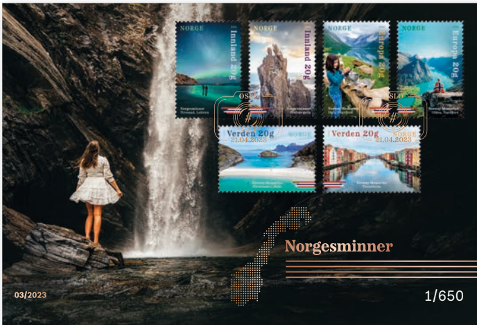
◀ Goldbrief NOK 178