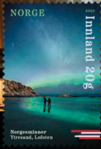
NK 2093 Nordlichter über Ytresand auf den Lofoten