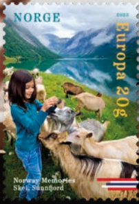
NK 2095 Ziegenherde bei Skei in Sunnfjord