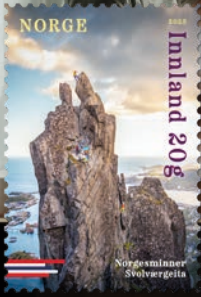
NK 2094 Die Felsformation Svolværgeita