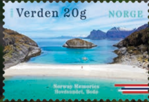
NK 2097 Hovdsundet bei Bodø