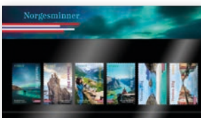
▶ Geschenkpäckung NOK 186