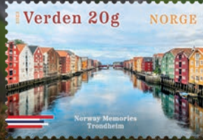
NK 2098 Bryggerekkja in Trondheim