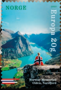
NK 2096 Olden am Nordfjord