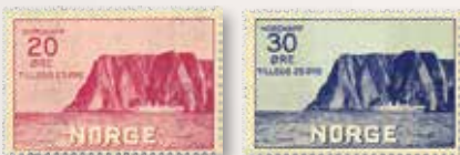
1930 Nordkapp I NK 182 20+25 øre.....kr 575 NK 183 30+25 øre.....kr 1200