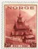
1939 Turistfrimerker u/ vannmerke NK 221 x 20 øre, tykt gullig papir .....kr 375