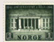
1941 Universitetsbygningen i Oslo 100 år NK 260 kr 1,00.....kr 500