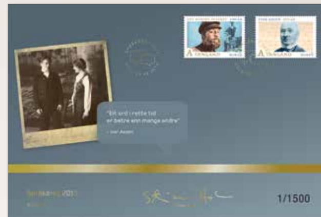
Gullbrev Kr 99,-

Nummer: NK 1858 - 1859 Motiv: Ivar Aasen, Lasse Kolstad i «Spelemann på taket» Design: Stian Hole (NK 1858) (NK 1859)