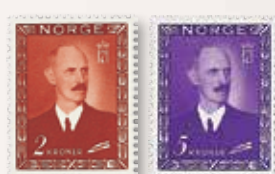
1946 Kong Haakon VII NK 352 kr 2,00.....kr 375 NK 353 kr 5,00.....kr 275