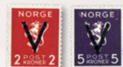
1941 V-merker u/ vannmerke NK 291 kr 2,00.....kr 200 NK 292 kr 5,00.....kr 275