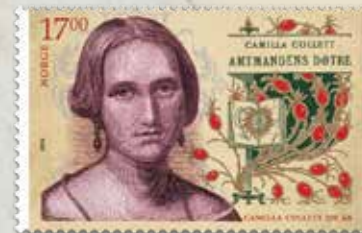
NK 1856 Portrett av Camilla Collett og forsiden av «Amtmandens Døttre».

Gina Krog var en sentral skikkelse i kampen for kvinners rett til utdanning og kvinnelig stemmerett. Krog grunnla Norsk Kvinnesaksforening