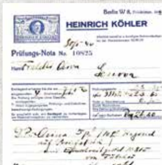
Faktura fra Köhler fra 1940 for utført undersøkelse av frimerker.