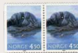
1995 Norden XI, vanlig papir NK 1226 y kr 4,50 x 2.....kr 200