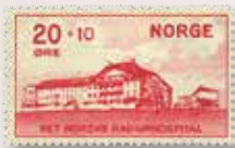
1931 Radiumhospitalet NK 184 20+10 øre.....kr 375