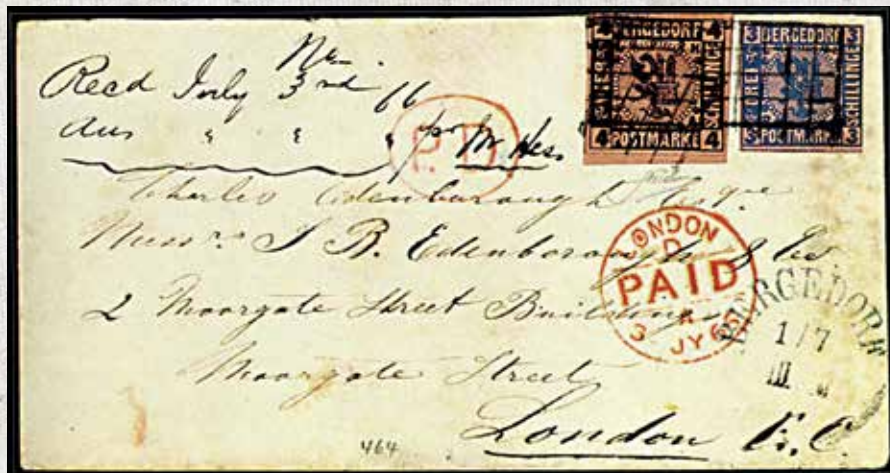
Brev fra den tyske staten Bergedorf solgt fra Boker-samlingen hos for 1 145 750 kroner.