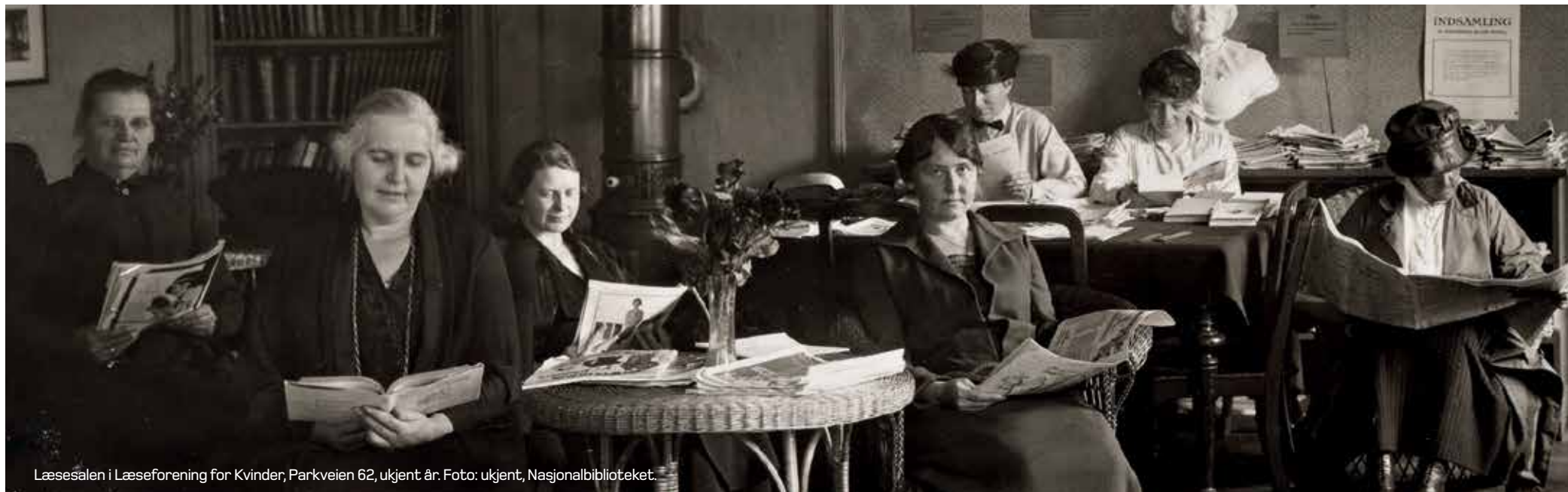
Læsesalen i Læseforening for Kvinder, Parkveien 62, ukjent år.

og tre andre nå opphørte kvinnesaksorganisasjoner. Kravet om full stemmerett for kvinner både til lokale og nasjonale valg var en svært sentral sak for kvinnesaksforeningen. Og den 11. juni i 1913 skjedde det; norske kvinner fikk full stemmerett. Men kampen startet mange år tidligere.