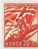
1941 Den norske legion NK 259 20+80 øre..... .....kr 750