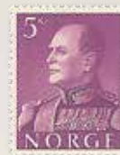
1959 Kong Olav V NK 472 kr 5,00..kr 450