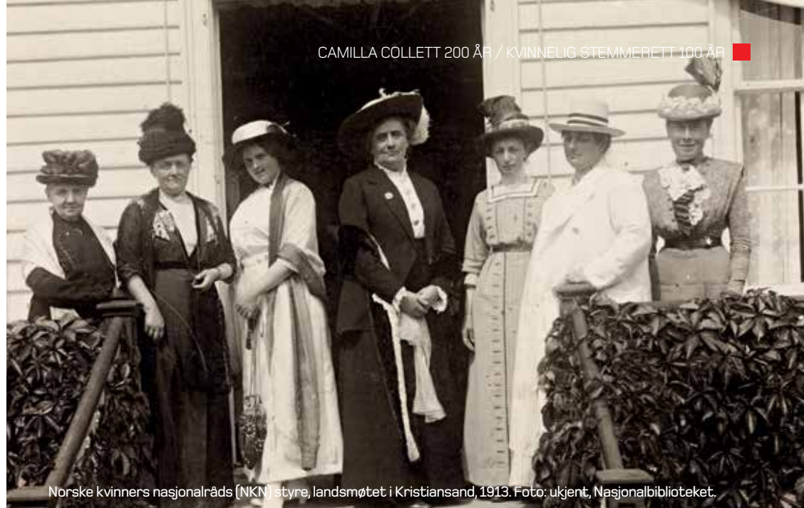
Norske kvinners nasjonalråds (NKN) styre, landsmøtet i Kristiansand, 1913.