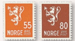
1946/49 Løve III NK 357 55 øre.....kr 325 NK 358 80 øre.....kr 325