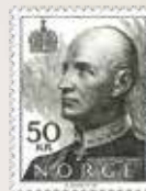
1992 Kong Harald V, vanlig papir, tg. 13 1/4 x 13 NK 1149 ly kr 50,00 .....kr 300