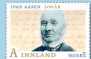
NK 1858 Portrett av Ivar Aasen. I bakgrunnen tekst til «Mellom bakkar og berg».