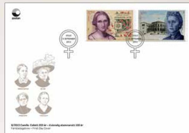
▲ Førstedagsbrev Kr 53,-

Nummer: NK 1856 - 1857 Motiv: Camilla Collett, Anna Rogstad Kunstner/gravør: Anild Yttri Verdier: Kr 17,00 – kr 30,00 Opplag: 500 000 av hvert frimerke Utgitt i: Ark à 50 frimerker Trykk: Kombinasjon ståltrykk/offset fra Joh. Enschedé Security Print, Nederland