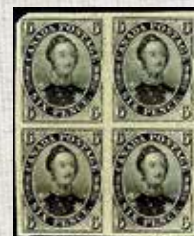
Köhler selger objekter fra hele verden, og i september 2009 ble denne blokken fra Canada solgt for 519 350 kroner.