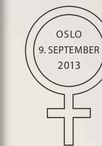
Førstedagsstempel Tegnet for hunkjønn

Nummer: NK 1856 - 1857 Motiv: Camilla Collett, Anna Rogstad Kunstner/gravør: Anild Yttri Verdier: Kr 17,00 – kr 30,00 Opplag: 500 000 av hvert frimerke Utgitt i: Ark à 50 frimerker Trykk: Kombinasjon ståltrykk/offset fra Joh. Enschedé Security Print, Nederland