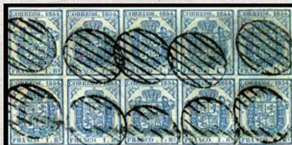
Spanias 1 real fra 1854 solgt hos Köhler i mars 2008 for 1 278 800 kroner.