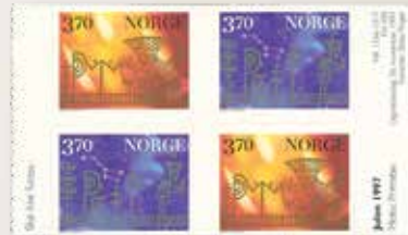
1997 Julefrimerker, fosforescerende papir NK 1316-1317 y kr 3,70 x 4.....kr 700