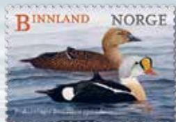
NK 1917 Praktærfugl ( Somateria spectabilis ) hann (foran) og hunn.