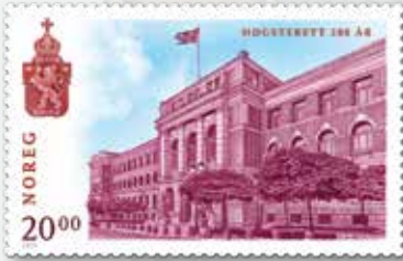
NK 1916 Høgsteretts hus i Oslo.