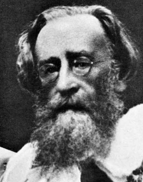
Portrett av Earl of Crawford and Balcarres, K.T., F.R.S (1847-1913), samt to karikaturtegninger.