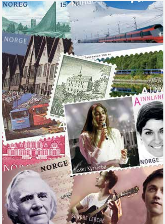
NK 880, NK 906, NK 1205, NK, 1231, NK 1620, NK1715-16, NK 1746, NK 1797 og NK 1824 sammensatt i tilfeldig rekkefølge.