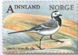
NK 1919 Linerle ( Motacilla alba ).