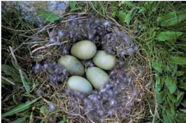
Ærfuglreir med edderdun.