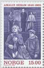
1996 Amalie Skram 150 år NK 1275 kr 3,50.....10,- NK 1276 kr 15,00.....42,-