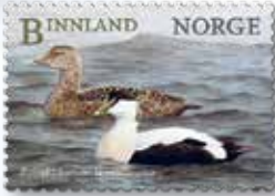
NK 1918 Ærfugl ( Somateria mollissima ) hann (foran) og hunn.