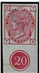
Foto oppe: Lord Crawford eide også dette amerikanske postmesterprovisoriet fra Annopolis 1846 eller 1847. Foto nede: Uhyre sjeldent sett klippet fra godkjennelsesark fra 1867 med platenummer. Lord Crawford hadde mange slike objekter.