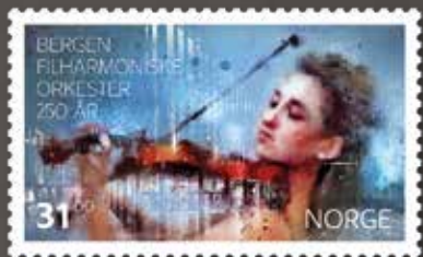
NK 1921 Fiolinist foran Grieghallen.