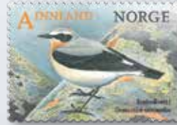
NK 1920 Steinskvett ( Oenanthe oenanthe ) hunn.