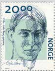
2002 Nordahl Grieg 100 år NK 1474 kr 20,00.....50,-